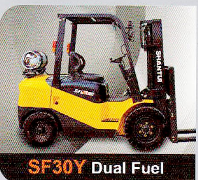
SF30Y Dual Fuel