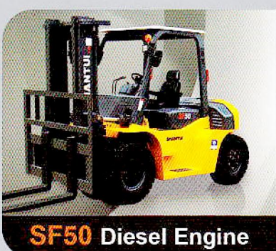
SF50 Diesel Engine