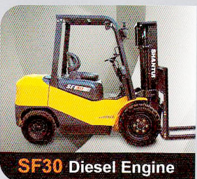
SF30 Diesel Engine