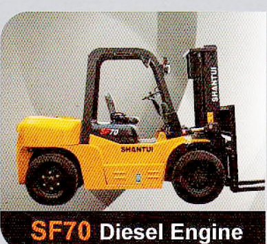
SF70 Diesel Engine