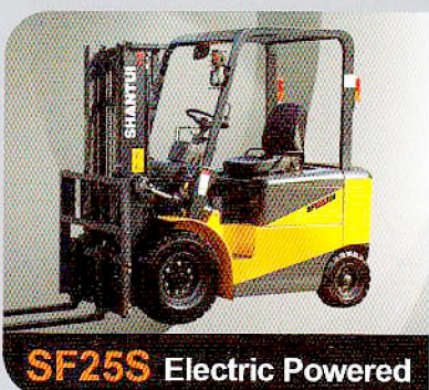
SF25S Electric Powered