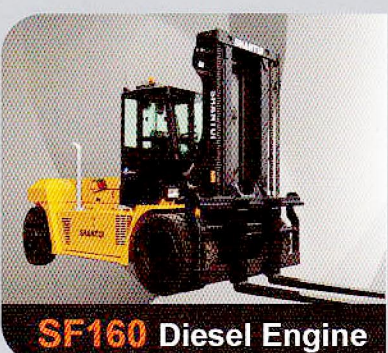
SF160 Diesel Engine